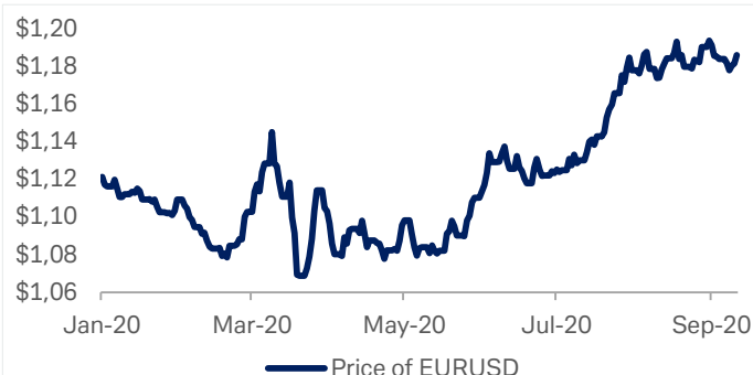
Grafico 1: Tasso di cambio EUR / USD nel 2020

Fonte: Bloomberg Finance LP, Deutsche Bank AG. 11 settembre 2020.